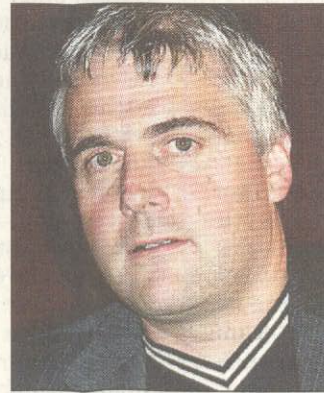
Gerald Pruckner

ken. Wenn die EU und der Finanzplatz London – über ihn laufen 30 Prozent der Devisentransaktionen – darauf eingehen würden. Tun sie aber nicht.